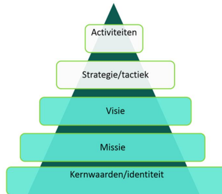
Figuur 1: de piramide van Kim

Hieronder een beschrijving van onze kernwaarden/identiteit (wie/wat willen we zijn?), onze missie (wat is onze opdracht?) en visie (wat is ons toekomstbeeld?).