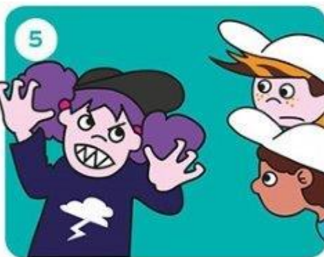
Gaat het door?