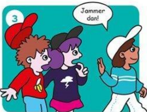
Ga iets anders doen.