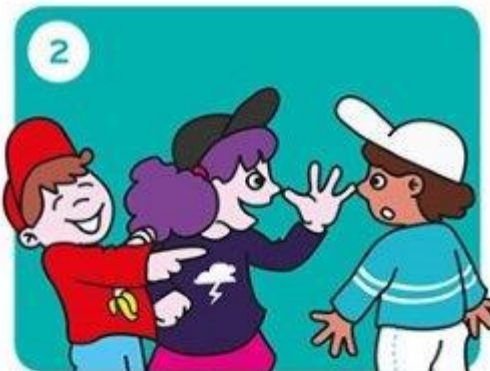
Gaat het door?