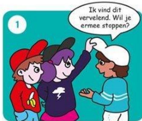
Zeg dat je het niet leuk vindt.