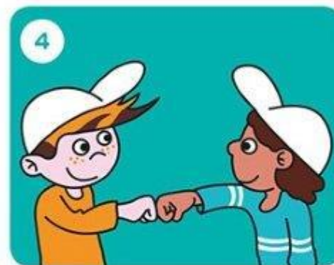
Stap naar je maatje of jouw maatje stapt naar jou.