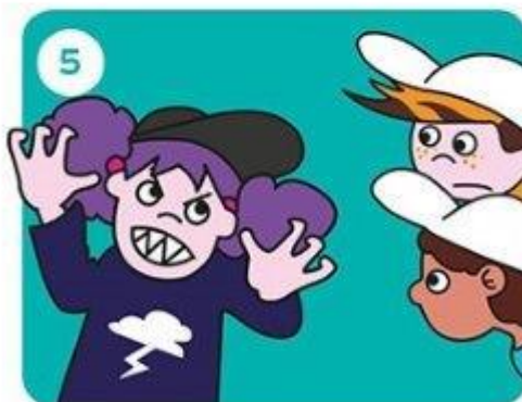
Gaat het door?