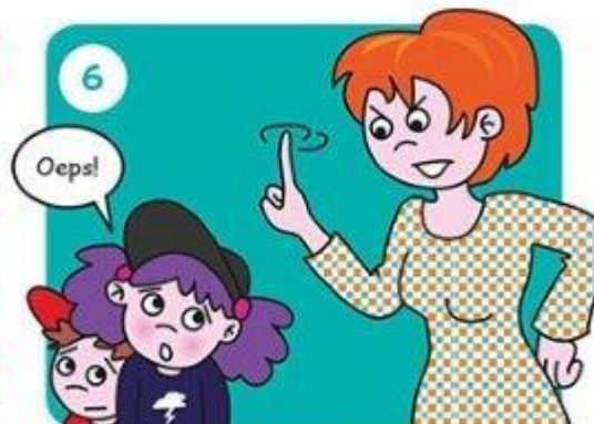
Ga naar je juf of meester. Die grijpt in.