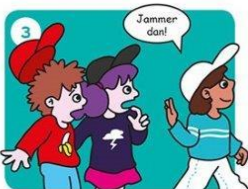
Ga iets anders doen.