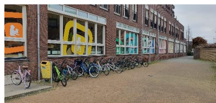
fietsrekken aan de zijkant van de school