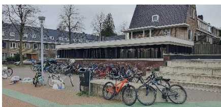
fietsrekken voor de school

We zien dat laatste tijd meer kinderen met de fiets naar school komen. Dat is natuurlijk een mooie ontwikkeling. Het betekent ook dat we fietsenrekken tekort komen. Weet dat er ook fietsenrekken zijn aan de zijkant van de school. Daar is vaak nog plek om je fiets te stallen (zie ook bijgevoegde foto's). We zijn met de gemeente in overleg of er fietsenrekken bij kunnen komen.