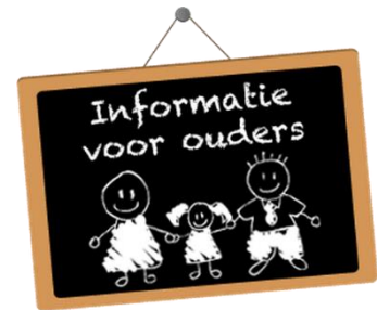
Foto en filmopnamen

U kunt ook onze nieuwsbrief in de gaten houden. Iedere twee weken staat er een gezonde traktatietip in.