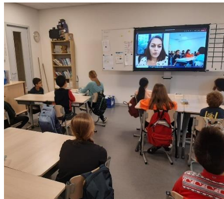
Een 'bezoekje' vanuit China!