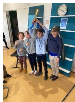
Finalisten en winnaar van de 1e prijs, Montessorischool Steigereiland BBE team 1

Op woensdag 20 maart vond in onze school de eerste editie plaats van het schaaktoernooi voor basisscholen op IJburg. Tien teams streden, verdeeld over twee poules, om een plaats in de finale. De winnaars van poule A en poule B, De Archipel en Steigereiland BBE1, waren aan elkaar gewaagd in de finale. Het leverde een spannende partij op, waarbij de bordpunten de doorslag gaven in het voordeel van team