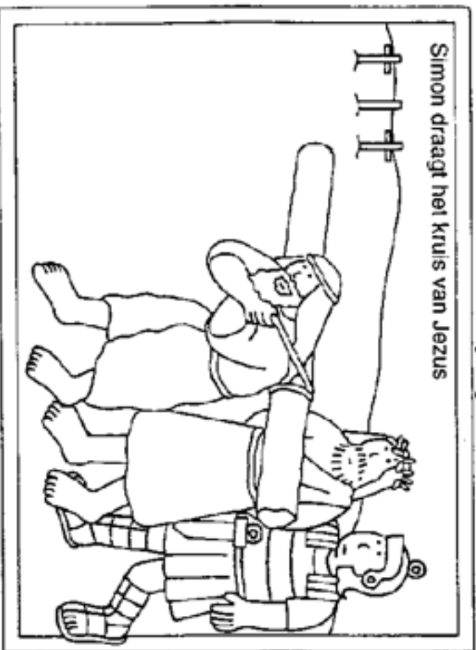
Simon draagt het kruis van Jezus