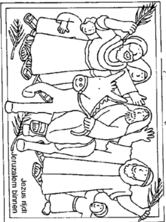
Jezus rjdt Jeruzalem binnen