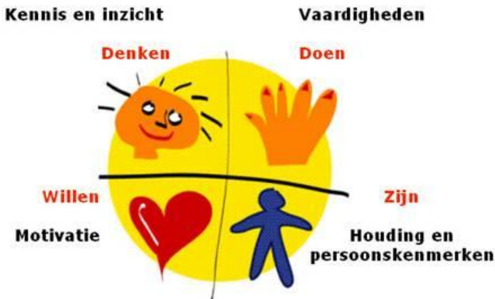
Afbeelding 3 Competentie

Onder een competentie verstaan we het samenspel (juiste mix) van: kennis & inzichten, vaardigheden, houding/persoonskenmerken en motivatie