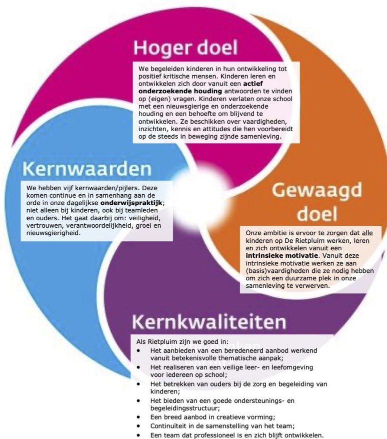
Figuur 1 Visie van onze school