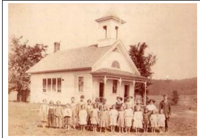
De Black School, circa 1910

Parkhurst wil het vanaf het begin anders doen, anders dan dat zij zelf lesgekregen heeft en anders dan haar voorgangers op het plattelandsschooltje lesgegeven hebben. In de lange zomervakantie van 1904 bereidt Parkhurst zich grondig voor. Ze overdenkt de consequenties van haar keuze om onderwijzeres te worden en er ontspint zich de gedachte om het over een andere boeg te gooien, te experimenteren en te leren om les te geven op een manier waarbij leerlingen plezier beleven aan haar onderwijs.