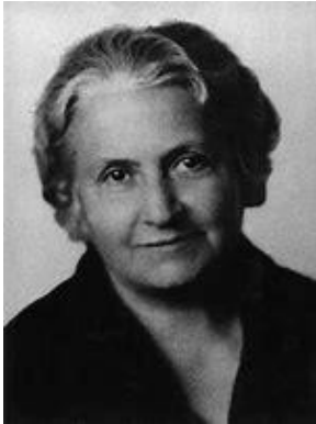
Maria Montessori: "Help mij het zelf te doen".

Als Montessorischool werken wij aan de einddoelen zoals ze zijn gesteld binnen het curriculum van het basisonderwijs in Nederland. Onze aanpak volgens de visie van Maria Montessori bepaalt de weg hoe deze einddoelen te bereiken.