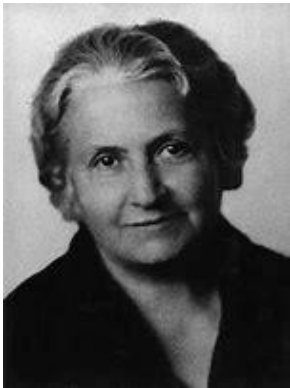
Maria Montessori: "Help mij het zelf te doen".

Als Montessorischool werken wij aan de einddoelen zoals ze zijn gesteld binnen het curriculum van het basisonderwijs in Nederland. Onze aanpak volgens de visie van Maria Montessori bepaalt de weg hoe deze einddoelen te bereiken.