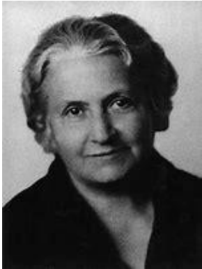
Maria Montessori: "Help mij het zelf te doen".

Als Montessorischool werken wij aan de einddoelen zoals ze zijn gesteld binnen het curriculum van het basisonderwijs in Nederland. Onze aanpak volgens de visie van Maria Montessori bepaalt de weg hoe deze einddoelen te bereiken.