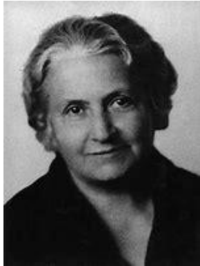
Maria Montessori: "Help mij het zelf te doen".

Als Montessorischool werken wij aan de einddoelen zoals ze zijn gesteld binnen het curriculum van het basisonderwijs in Nederland. Onze aanpak volgens de visie van Maria Montessori bepaalt de weg hoe deze einddoelen te bereiken.