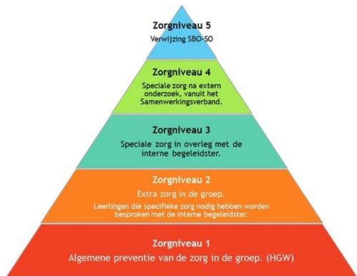
figuur 3 Schema zorgniveaus

Speciale zorg in overleg met de interne begeleider