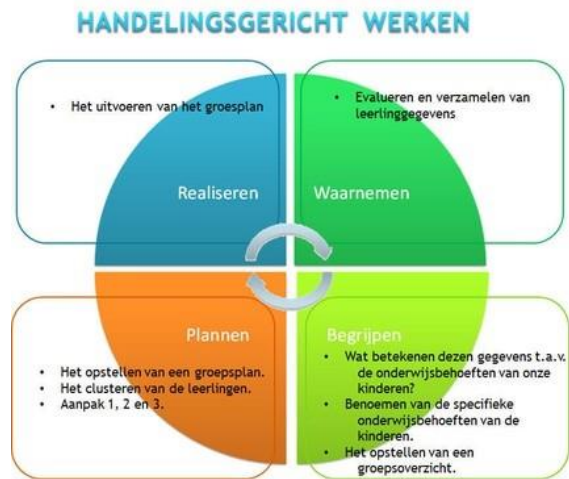
figuur 1 Handelingsgericht werken

De volgende uitgangspunten zijn voor ons als school en voor de leerkracht belangrijk: