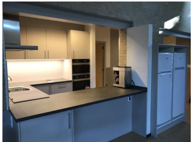
en na de verbouwing.