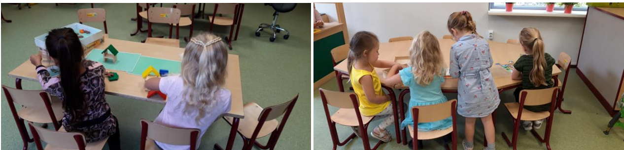
In groep 1 / 2 worden bouwwerken vanaf tekeningen in het echt nagebouwd en worden er weer mooie kralenplanken gemaakt.