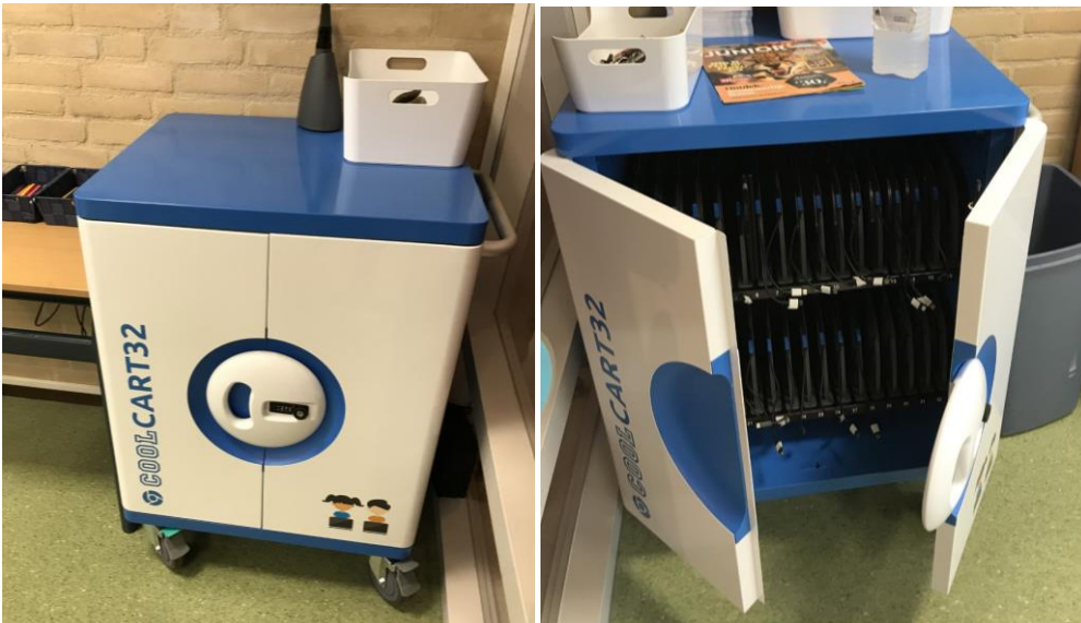
Groep 5 en 6 hebben een eigen chromebookkast. Iedere leerling heeft een eigen chromebook in bruikleen op school. In de kast worden de chromebooks automatisch opgeladen.