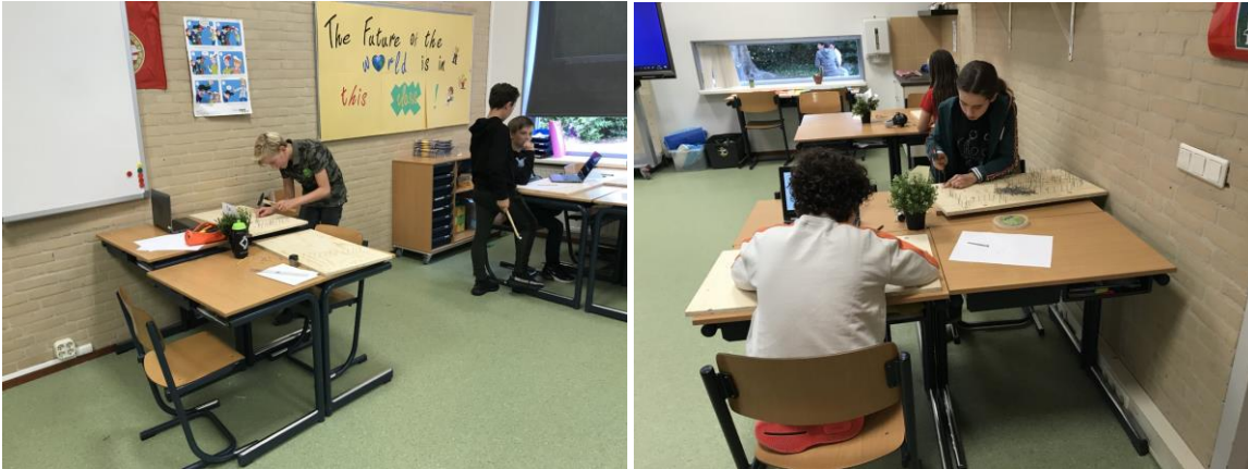
Groep 8 werkt aan de aankleding van het lokaal.