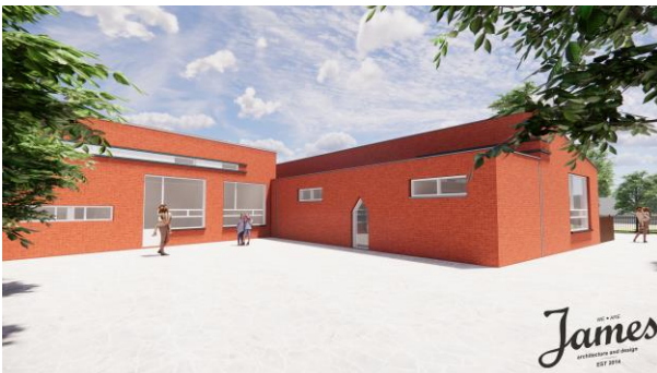
Gevel aanbouw voorzijde