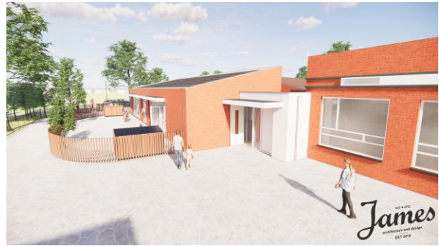
Gevel aanbouw aan achterzijde