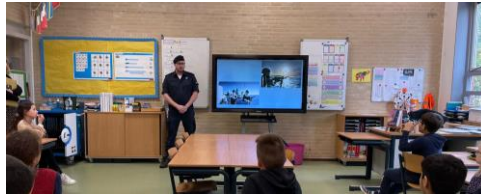
Een militair vertelt in groep 6 over zijn beroep