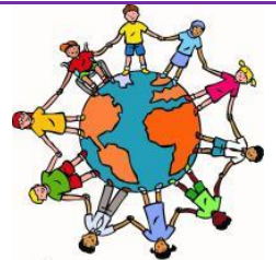
We zijn allemaal anders

We hebben nog fijne laatste weken met elkaar. We praten tijdens de lessen van de Vreedzame School over dat we allemaal anders zijn en hoe mooi dat eigenlijk is. We zijn veel buiten en we zoeken nog steeds naar kriebelbestjes, de kinderen hebben er al veel over geleerd! Volgende week staat de letter v centraal. De laatste twee gymlessen op de dinsdag hebben we weer in het speellokaal ipv buiten.