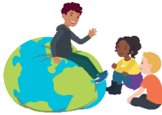
We hebben oor voor elkaar

Bij de kleuters staan op de voorkant van deze kaart Aap en Tijger. Dit zijn de handpoppen die bij de lessen van De Vreedzame School regelmatig een hoofdrol spelen. Bij de andere groepen een afbeelding passend bij het blok.