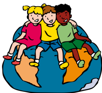
We horen bij elkaar

Iemand vertelt dat ze met z'n allen taken hebben bedacht voor in de klas en deze hebben verdeeld onder elkaar. WE vinden het eigenlijk wel zo eerlijk dat alle kinderen uit de klas mogen meebeslissen in het takenschema voor de klas: bijvoorbeeld kasten netjes houden, 'ik vind opruimen leuk, hoorden we in een groep'