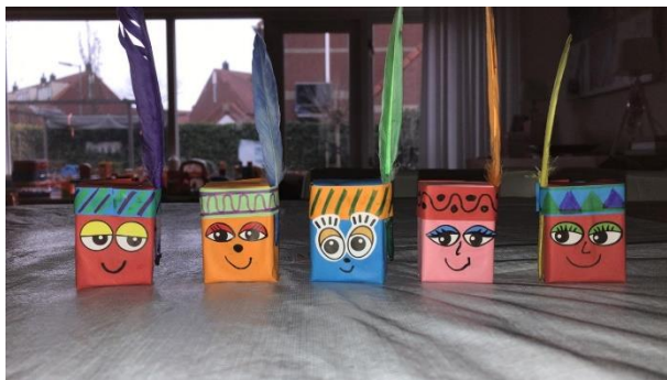
(voorbeeld van verpakte rozijnendoosjes)

Kijkt u anders eens op onderstaande link met veel leuke ideeën: