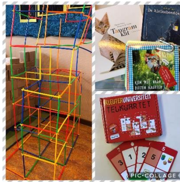
Bouwen met rietjes, telkwartet, prentenboeken, buitenspeel kaarten