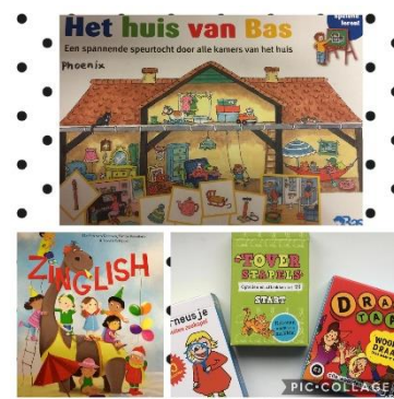
Bordspel het huis van Bas, Zinglish (liedjes en Engels), taal- en rekenpelletjes