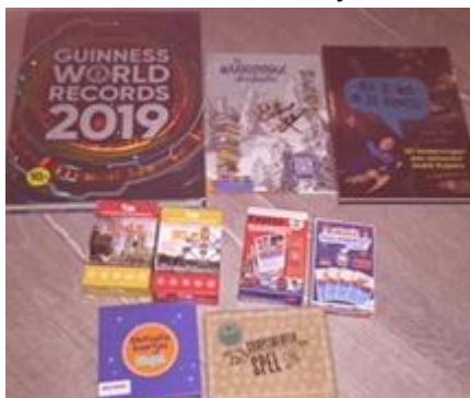
Complimentenkaartjes, Engels kwartetspel en leesboeken

Woensdag 23 januari j.l. zijn wij met alle scholen van de Blauwe Loper naar de NOT geweest. Dit is een onderwijsbeurs die ééns in de twee jaar plaatsvindt in de jaarbeurshallen in Utrecht. Alle nieuwe ontwikkelingen op het gebied van onderwijs zijn hier te zien; van nieuwe methodes, lesmaterialen, ICT, kinderboeken, meubilair, buiten-speelmateriaal tot schoolpleininrichtingen. Omdat hier zoveel mooie dingen te zien én te koop zijn mochten wij ook nog per groep wat van deze materialen aanschaffen! Per groep is er natuurlijk gekeken naar waar behoefte aan is (bij kinderen en leerkrachten). Hieronder een greep van deze nieuwe materialen. We zijn er heel blij mee!