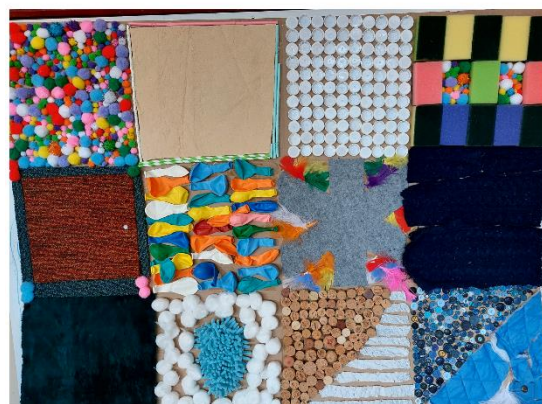
zacht en hard