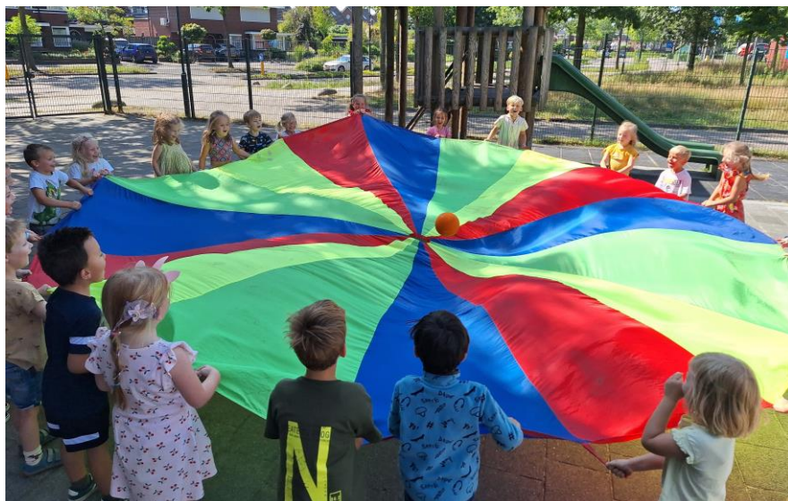
Groep 2B speelt lekker buiten

Mocht u vragen en/of opmerkingen hebben, dan kunt u terecht bij de groepsleerkracht.