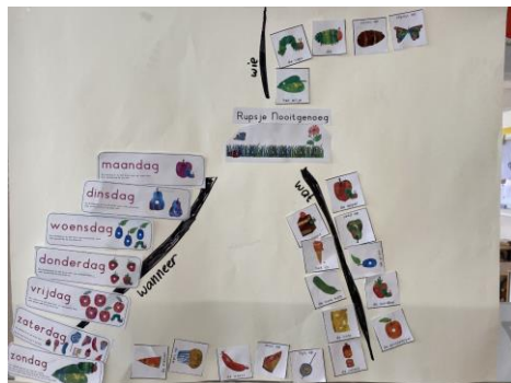
Mindmap groep 1

Met het maken van mindmaps combineren kinderen hun denkvermogen met hun creatieve vermogen. Daarnaast leren ze ook hoe ze het beste kunnen samenwerken en hoe ze op een eerlijke manier taken kunnen verdelen.