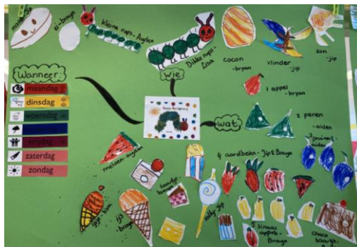
Mindmap groep 2