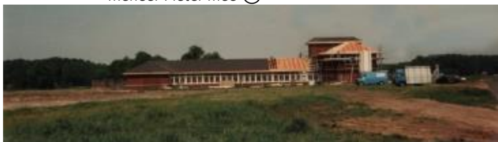
Mei 1996 Basisschool Dierdonk in aanbouw midden in de weilanden