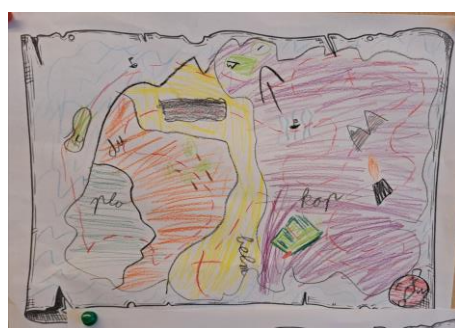
Landkaart gemaakt in groep 4

De kinderen van de groepen 5-6 waren onze wereldstrijders met hun thema "Red de wereld". Ze hebben vol enthousiasme gewerkt aan het Spraakwater Project, waar al eerder iets over in de nieuwsbrief verscheen. De groepen 7-8 hebben zich beziggehouden met "het Milieu". Zij hebben vorige week al in de nieuwsbrief laten zien wat ze allemaal geleerd hebben.