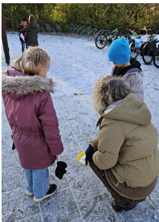
Groep 4 had afgelopen vrijdag een actieve rekenles