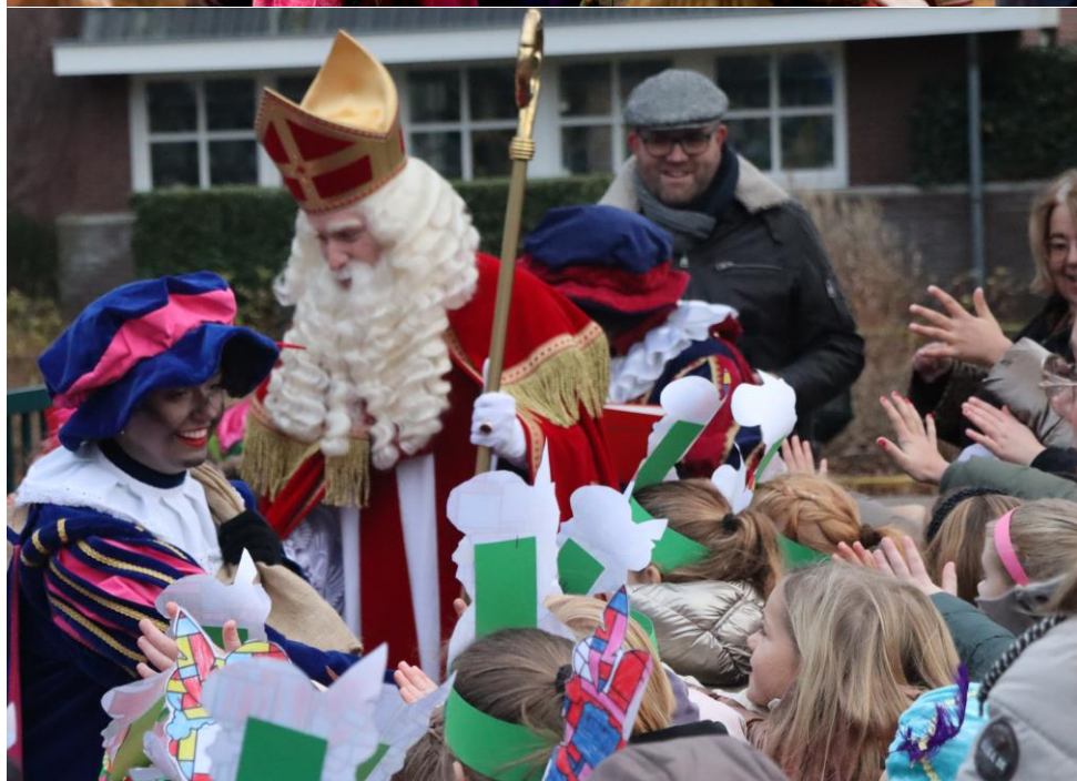
5 december, wat een sfeervolle dag