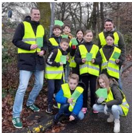
'Groene kaarten actie' 2023

Deze dag willen we het belang van fietsend of lopend brengen en halen én de verkeersveiligheid rondom school nog eens onder de aandacht brengen. Juist om alle kinderen elke dag weer veilig op school of thuis te laten komen. Alleen op die manier leert een kind waar het onderweg rekening mee moet houden en welk gedrag het meest verantwoord is. U doet toch ook mee?