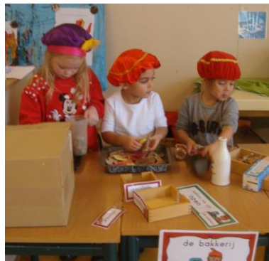
Pepernoten bakken in groep 1