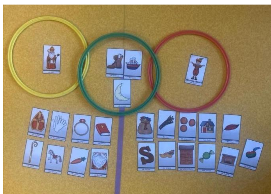
Venndiagram groep 2