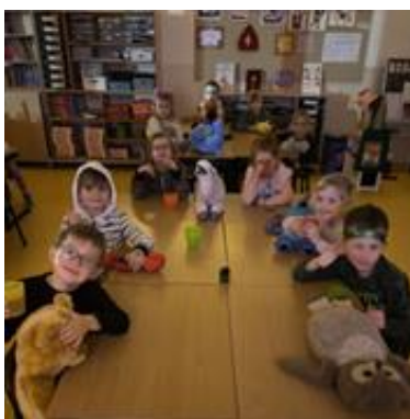
Pyjamafeest groep 3

In de groepen 4 werd ook feest gevierd. De kinderen vierden niet alleen feestjes in de klas, maar gingen ook op ontdekking hoe er in de wereld op verschillende manieren feest gevierd wordt. Zo hebben ze veel informatie gekregen en deze ook aan elkaar gepresenteerd.