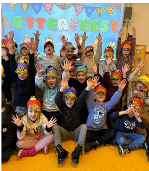
Letterfeest in groep 3