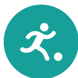
Spel en beweging/ bewegingsonderwijs