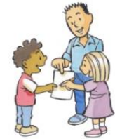
2. WIJ DOEN HET SAMEN