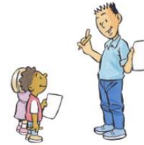
1. IK DOE HET VOOR