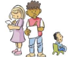
4. JIJ DOET HET ZELF