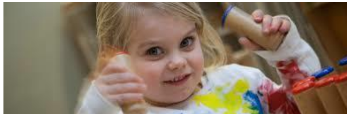
Belofte 2: "Ik kan kiezen"

Montessori wilde de kinderen vrijheid geven. Op school mogen kinderen zelf kiezen waarmee ze gaan werken (keuzevrijheid). Zolang ze geboeid blijven, werken ze met het materiaal, in hun eigen tempo (tempovrijheid). Deze manier van werken stelt leidsters in staat ook tegemoet te komen aan de wensen van kinderen die minder snel zijn of die zich juist heel snel ontwikkelen. Elk kind doet datgene wat hij of zij kan (niveauvrijheid). De leidsters, die allen speciaal opgeleid zijn, zorgen ervoor dat kinderen leerstof en materiaal op maat aangeboden krijgen op het moment dat ze daaraan toe zijn. De kinderen krijgen de vrijheid die ze aankunnen, maar de leidsters en de school verliezen nooit de eisen van het moderne Nederlandse basisonderwijs uit het oog.