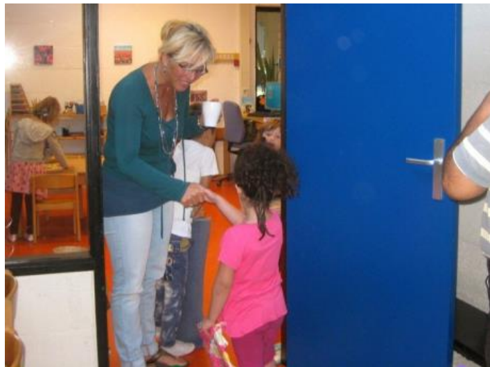
Belofte 4: "Ik doe ertoe".

Bij het binnenkomen in de klas geeft de leidster ieder kind een hand. Een persoonlijk contact voordat de werkperiode begint. Gedurende het hele schooljaar werkt de leidster eraan het kind te leren kennen en een warme band met hem of haar op te bouwen.