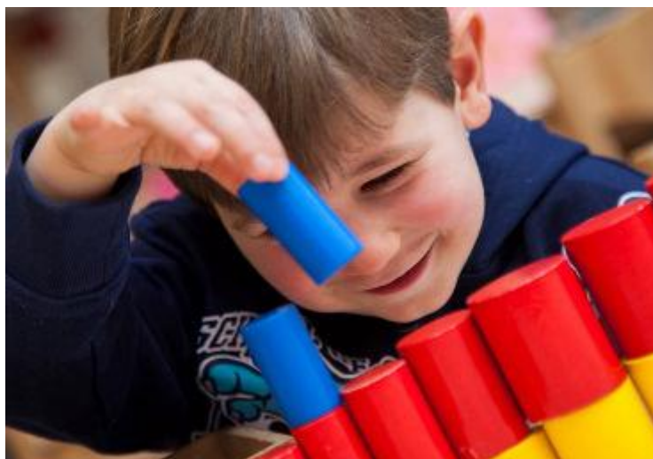
Belofte 1: "Ik weet wat ik wil"