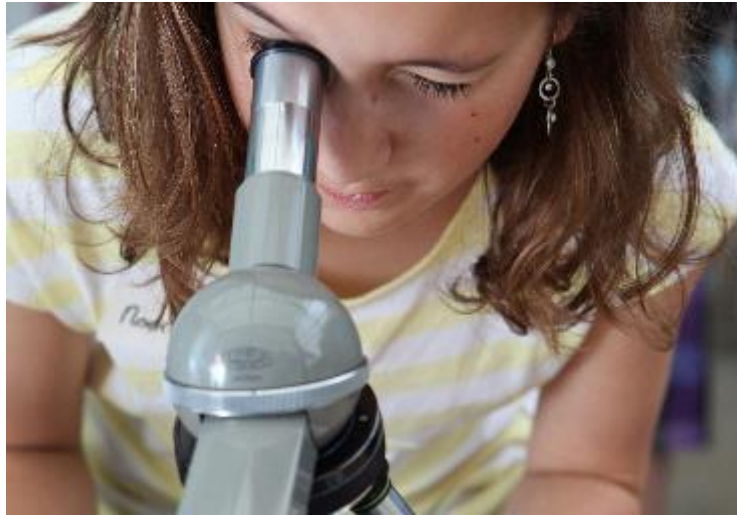
Belofte 3: "Ik blijf nieuwsgierig".

Kosmisch onderwijs neemt in het montessorionderwijs een belangrijke plaats in. Het onderwijs gaat uit van het grote geheel en laat de kinderen ervaren dat alles en iedereen op aarde daar een schakeltje van is. De verschillende vakgebieden worden geïntegreerd aangeboden. Aardrijkskundige, geschiedkundige, natuurkundige en technische onderwerpen worden benaderd vanuit het grote geheel en daarna vertaald naar de eigen situatie. Het kosmisch onderwijs blijft interessant en levendig met projecten, aanschouwelijk materiaal en zelfgemaakte werkjes. Al heel jong leren kinderen hun eigen werkstukken te maken.