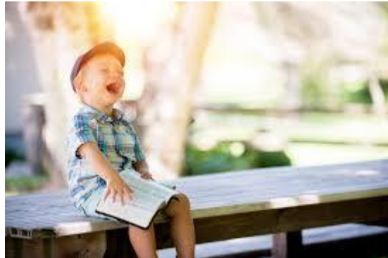
Belofte 6: "Ik bewijs dat ik het kan".

Met deze doelen leren de kinderen duidelijk doelgericht te werken aan hun eigen ontwikkeling. De doelen zijn zo geordend dat een kind in acht jaar tijd (vrijwel) alle doelen kan behalen. Het kind bewijst zelf wanneer het een bepaald doel heeft behaald en bewaart een aantal bewijsstukken (een bewijs op papier, een foto, feedbackverslag, een toetsscore, enz) ervan in het Doelenboek.