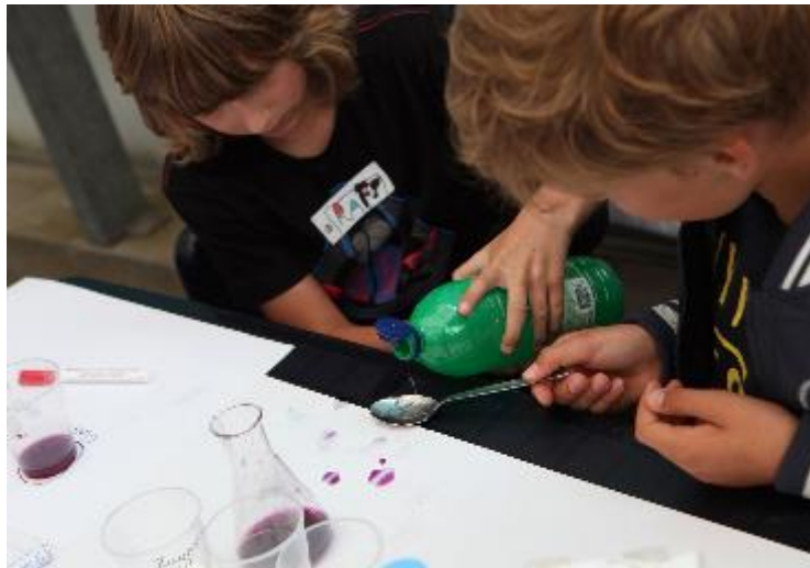
Belofte 5: "Ik zoek oplossingen".

Ook de omgang tussen de kinderen onderling is een wezenlijk onderdeel van de montessorivisie. De kinderen leren ruzies uit te praten aan de vriendentafel. Lukt dat niet, dan wordt de hulp van de leidster ingeroepen of aangeboden. De leidster wijst de kinderen op de consequenties van hun gedrag en bespreekt het gedrag om zo gezamenlijk de omgang met elkaar te verbeteren. Deze aanpak gaat uit van het herstel van positief contact.