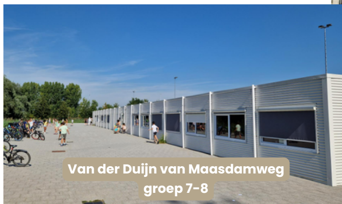
Van der Duijn van Maasdamweg groep 7-8