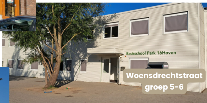
Woensdrechtstraat groep 5-6