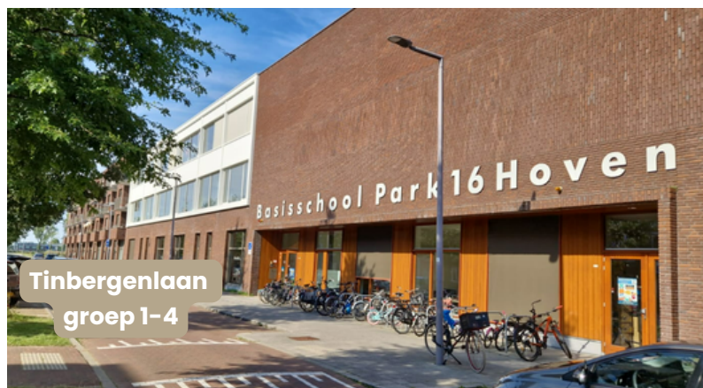
Tinbergenlaan groep 1-4

We willen graag dé school van de wijk zijn. De school, waar alle leerlingen uit de wijk zich veilig voelen, zich gezien voelen, kunnen groeien en kunnen zijn wie ze zijn. Ouders die onze school voor het eerst bezoeken, vragen wij steeds: Merkt u dat er in het gebouw aan de Tinbergenlaan bijna 500 kinderen aan het spelen en leren zijn? Steeds weer geven ouders aan dat er binnen de school heel veel rust is, dat de school zo ingericht is dat er voor alle leerlingen ruimte is om te kunnen werken en te ontdekken.