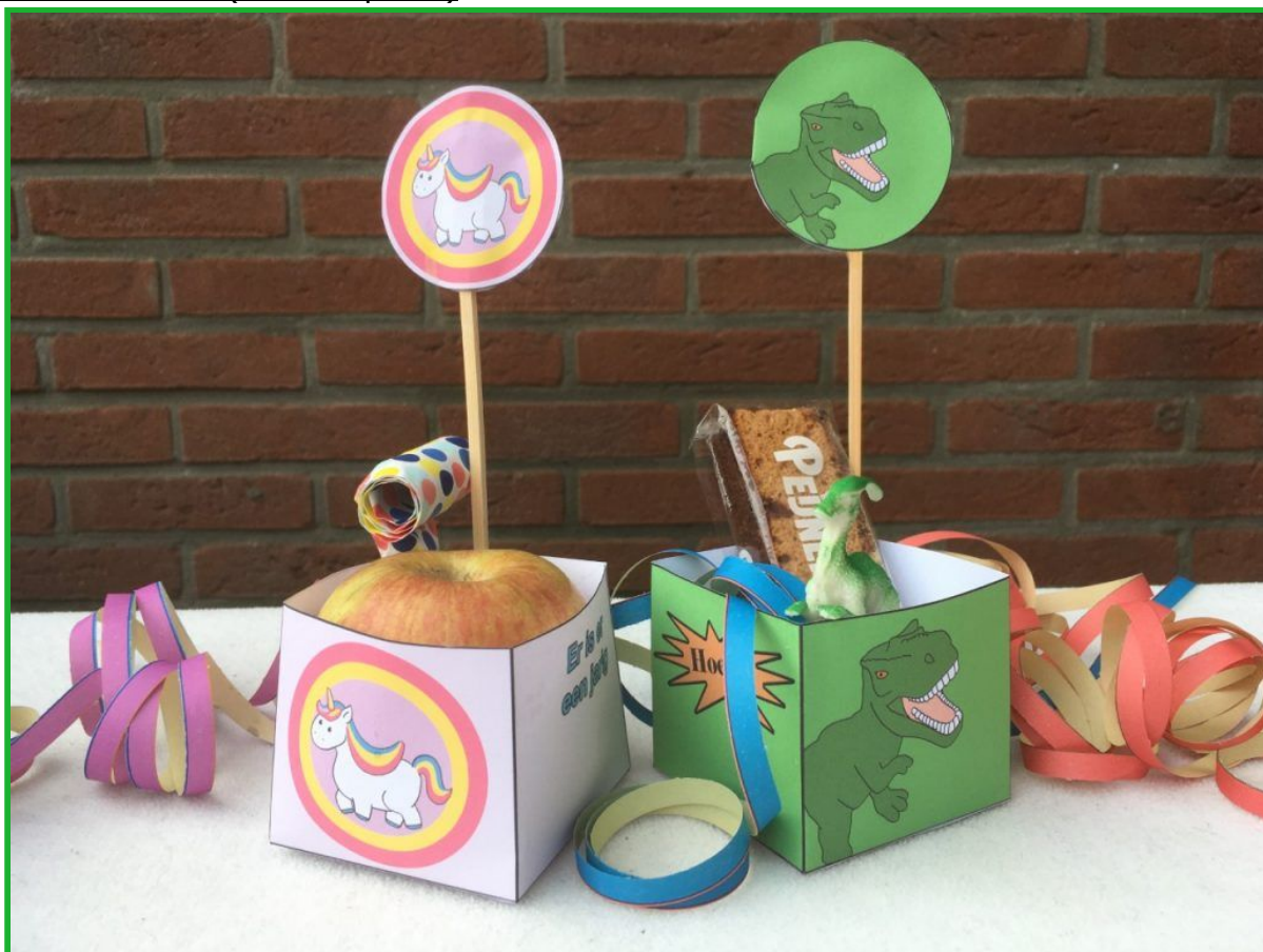
Traktatie-bakjes met (voorverpakte) traktatie, gratis printables .