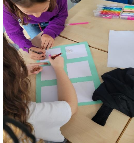
Een strip maken tegen pesten