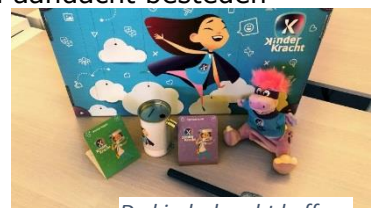
De kindkracht koffer.

Zo laten wij de kinderen de indeling van de dag bepalen aan de hand van de koffer, bedenken wij eigen spelletjes en hebben wij elke dag een 'eigen' superheld! De superheld is een hulpje van de juf maar dan op een hele speciale manier!