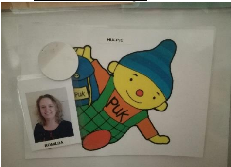
Pictobord: hulpje van de dag op de peuterspeelzaal.

Bij de peuteropvang (POV) noemen wij het kind dat centraal staat het 'hulpje van de dag'. 's Morgens hangt naast de dagplanning wie er die dag het hulpje is. Menig peuter vraagt dan ook al bij binnenkomst aan de ouder; "Wie is het hulpje vandaag? "