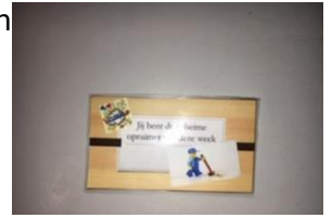
Kaart de geheime opruimer van de week.