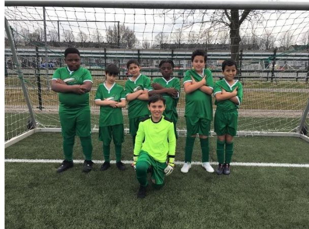
Springplank 1, door naar de volgende ronde!