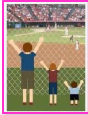
Gewoon waar het kan, aangepast waar nodig

Persoonlijke aandacht staat bij ons centraal