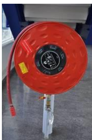
Eén van de brandslangen