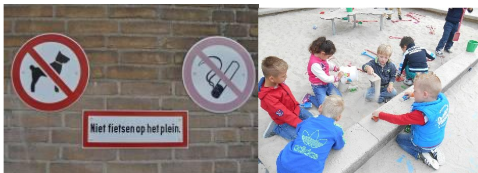
De verbodsborden op het schoolplein

Wij verzoeken u buiten het schoolplein te roken daar het verboden is dit op het schoolplein te doen. Honden zijn eveneens niet welkom op het schoolplein.