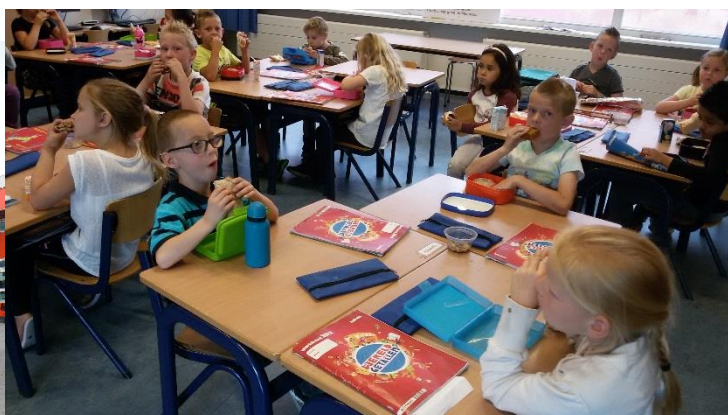
continurooster: Kinderen eten met elkaar