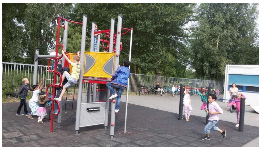
Het plein van de bovenbouw