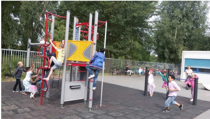
Het plein van de bovenbouw