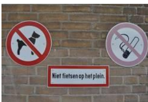
De verbodsborden op het schoolplein

Honden zijn eveneens niet welkom op het schoolplein.