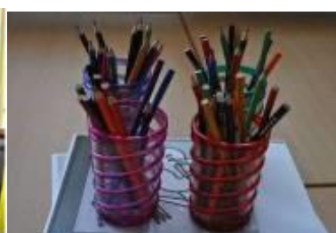
kleuren, schilderen, plakken, knippen