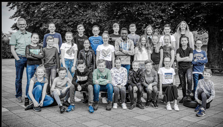
BASISSCHOOL MEANDER 2018-2019 GROEP 8