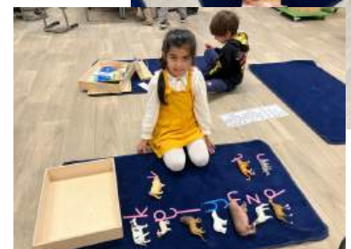
Montessori werkjes in de onderbouw