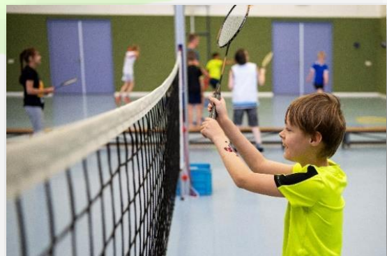
De Wingerd, schoolgids 2023-2024