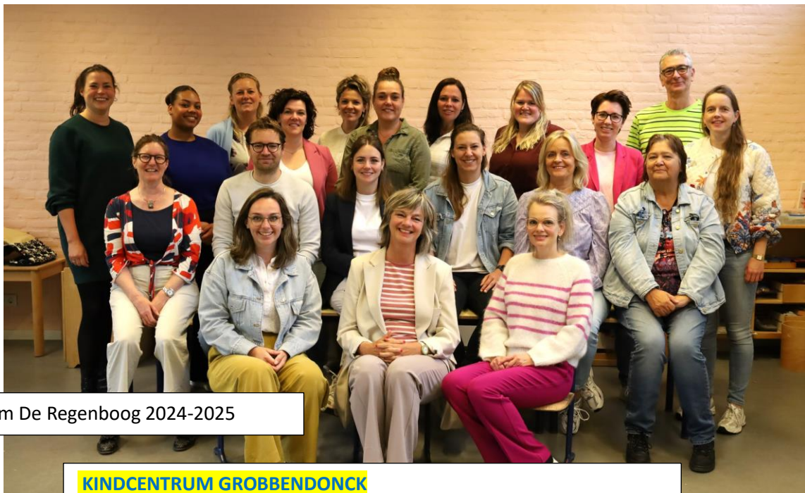
Team De Regenboog 2024-2025