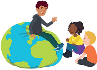
We hebben oor voor elkaar

Sinds half november werken alle groepen met blok 3 van De Vreedzame school, waar het gaat om "We hebben oor voor elkaar". Thuis kunt u hierop aansluiten door de bijbehorende Kletskaarten met uw kind(eren) te bespreken, waardoor zij merken dat dit ook thuis belangrijk wordt gevonden en Vreedzameschool-lessen ook buiten school te gebruiken zijn.